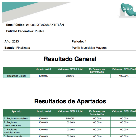
Imagen 5: Cumplimiento SEvAC

El Municipio también muestra un cumplimiento de validación de 100 % de la información reportada de manera trimestral con respecto a diversos temas de armonización contable, que tiene como propósito mostrar el grado de cumplimiento a la LGCG y lineamientos CONAC, mediante la plataforma del SEvAC, teniendo de manera individual los siguientes resultados;